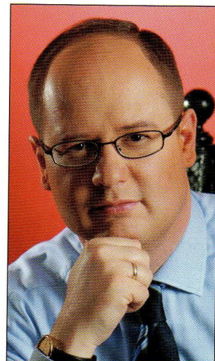
Paweł Adamowicz prezydent Gdańska prezes Unii Metropolii Polskich

Początkowo zdarzały się napięcia między miastami, zwłaszcza między miastami wybranymi do organizacji Euro 2012 i rezerwowymi: Krakowem i Chorzowem. Konflikt został jednak zażegnany przez premiera Tuska. Rząd polski wystąpił do UEFA o zwiększenie liczby organizatorów.