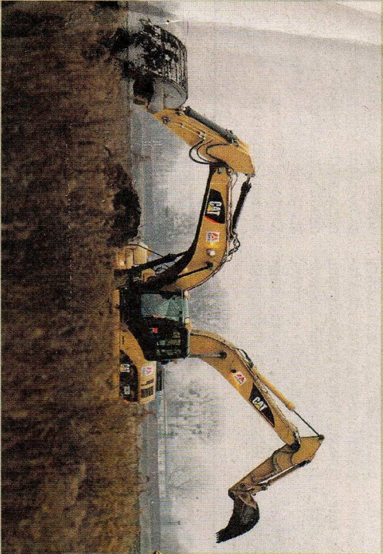
Wczoraj wystartowali. Teraz jednak także dla prezydenta Pawła Adamowicza (z prawej) przyszedł czas na wiele miesięcy ciężkiej pracy