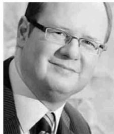
PAWEŁ ADAMOWICZ prezydent Gdańska